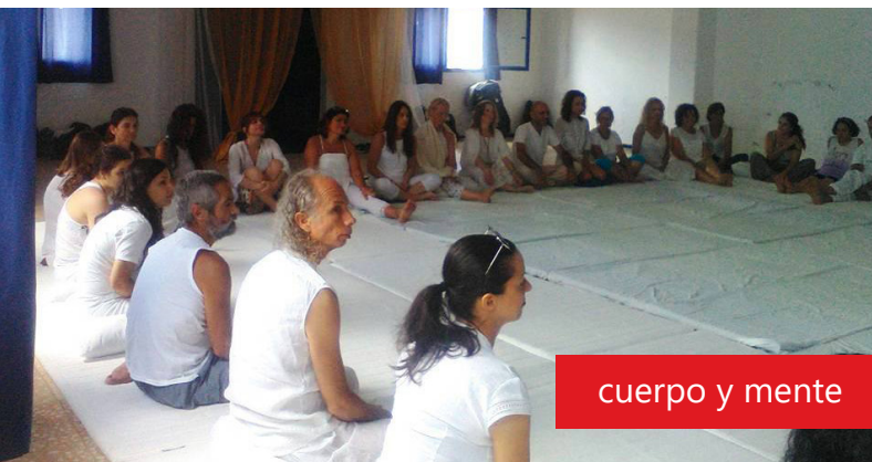
cuerpo y mente

La Graciosa acogió el tercer Campus de Meditación, un taller de amornización de cuerpo y mente, donde el arte del tacto y la presencia del que da y el que recibe nutre el cuerpo y el alma. Om shanti shanti Om. Todo lo que sucede en la mente (pensamientos, sentimientos y emociones) sucede también en el cuerpo.