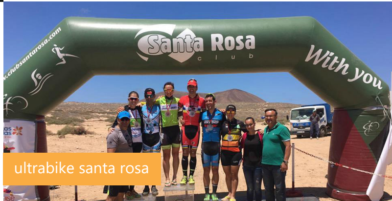
ultrabike santa rosa

La III Ultrabike Club Santa Rosa contó con 300 participantes. La salida de la Contrarreloj Líneas Marítimas Romero, de 16 kilómetros se realizó desde Caleta de Sebo, donde dieron comienzo tres días adrenalínicos en los que se pudo disfrutar de esta intensa competición en las islas de Lanzarote y La Graciosa que recorrió dos circuitos únicos por los increíbles.